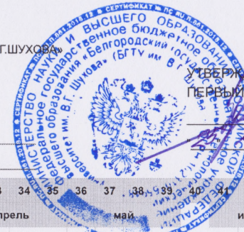
График учебного процесса 2022г

Направление 13.03.02 Электроэнергетика и электротехника