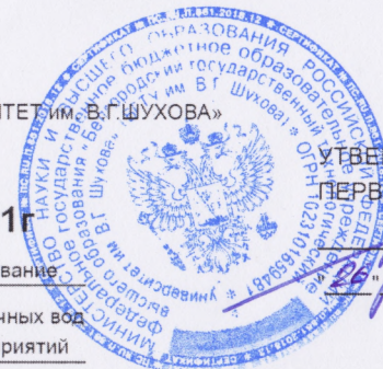
График учебного процесса 2021г