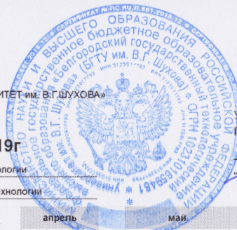
График учебного процесса 2019г

Направление 09.03.02 Информационные системы и технологии