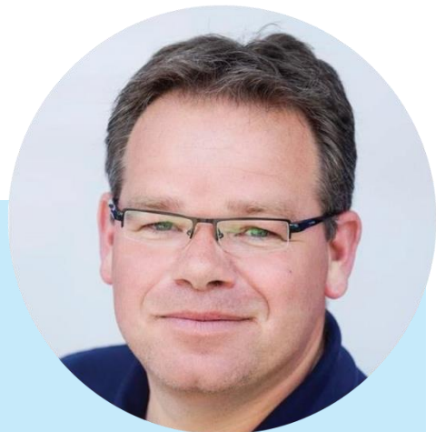
Хайн Роэлфсема профессор Школы экономики Утрехтского университета (Нидерланды)