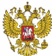
РОССИЙСКАЯ АКАДЕМИЯ ОБРАЗОВАНИЯ