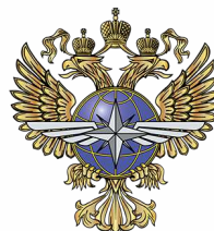
МИНИСТЕРСТВО ТРАНСПОРТА РФ