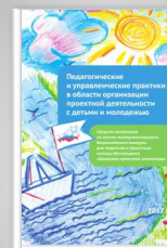
Сборник материалов «Школьная проектная олимпиада»