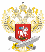
МИНИСТЕРСТВО ОБРАЗОВАНИЯ И НАУКИ РФ