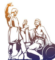
Общественная палата Российской Федерации CIVIC CHAMBER OF THE RUSSIAN FEDERATION