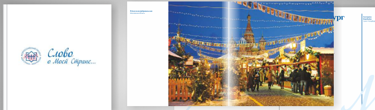
Альманах «Слово о моей стране...».