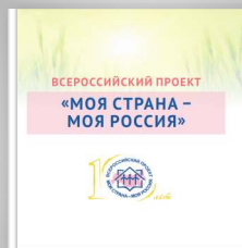
Итоговый сборник «Моя страна — моя Россия» 2015 г.