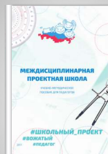
Учебно-методическое пособие для педагогов «Междисциплинарная проектная школа»