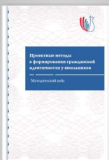
«Проектные методы в формировании гражданской идентичности у школьников»