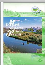
Итоговый сборник «Моя страна — моя Россия» 2017 г.