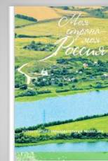
Итоговый сборник «Моя страна — моя Россия» 2014 г.