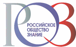
РОССИЙСКОЕ ОБЩЕСТВО ЗНАНИЕ