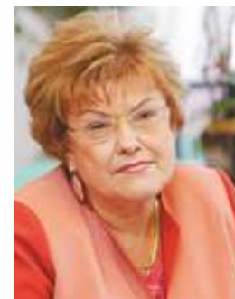
Ольга Юрьевна ВАСИЛЬЕВА Министр образования и науки Российской Федерации

«В условиях построения инновационной экономики, модернизации российского общества задача системной, эффективной работы с одаренными детьми и молодежью становится особенно актуальной. Одним из приоритетных направлений развития российского образования в последние годы является совершенствование условий для выявления и поддержки талантливых и одаренных детей, молодежи.»